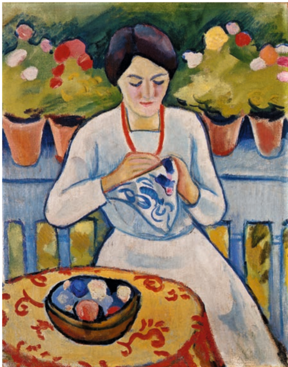
August Macke, Stückende Frau auf einem Balkon, 1910. Kunstmuseum Bonn, erworben mit finanzieller Unterstützung des Landes Nordrhein-Westfalen, Foto: René Hansen, Kunstmuseum Bonn

INSPIRATION MATISSE ERÖFFNUNG Ausstellungseröffnung → 19.00 Uhr Eintritt frei