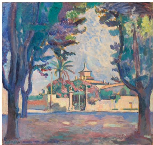
Henri Matisse, Place des Lices, Saint-Tropez, 1904

NADINE FECHT. AMOK FÜHRUNG Überblicksführung durch die Sonderausstellung → 15.30 Uhr 3 € zzgl. Eintritt