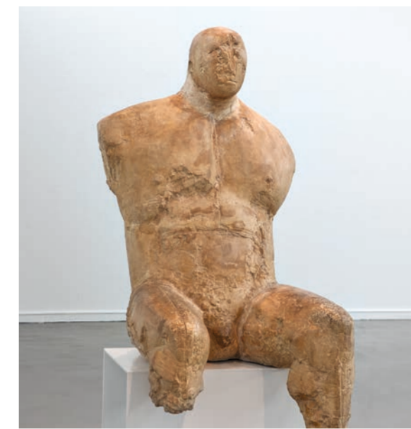
Gustav Seitz, Geschlagener Catcher, 1963–1969.

Der Mannheimer Künstler Gustav Seitz (1906–1969) gehört zu den ausdrucksstärksten deutschen Bildhauern der Nachkriegszeit. Unter dem Titel LEIB UND SEELE zeigt die Kunsthalle Werke aus der eigenen Sammlung sowie Leihgaben rund um die thematischen Schwerpunkte Liebe, Idole, Körper, Kampf und Porträt. Neben den skulpturalen Arbeiten stellt die Ausstellung das umfangreiche zeichnerische und grafische Werk des Künstlers vor. Die Ausstellung wird in zwei Räumen im Hector- und im Jugendstilbau präsentiert.