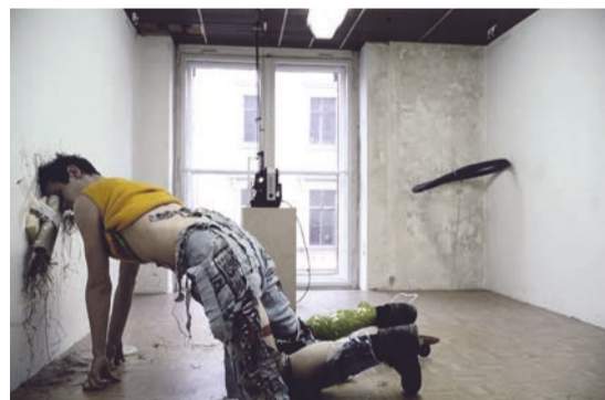
John Bock, LiquiditätsAuraAromaPortafolio, Berlin Biennale, 1998

John Bock (*1965) ist vor allem für seine spektakulären, komisch-grotesken Aktionen bekannt, in denen sich Theater, Performance, Vortrag, Video, Installation und Skulptur in einzigartiger Weise durchdringen. Die Kunsthalle rekonstruiert mit Hilfe einer privaten Schenkung seine Performance-Installation „LiquiditätsAuraAromaPortafolio“, mit der ihm auf der Berlin Biennale 1998 der Durchbruch als Künstler gelang. Ermöglicht wird dies durch die Art Mentor Foundation Lucerne, die darüber hinaus den Erwerb einer zweiten skulpturalen Arbeit finanziert: die sogenannte Summenmutation der Performance-Installation „Voll die Beule“ (2013, Installation und Video, 36 min., DVD).