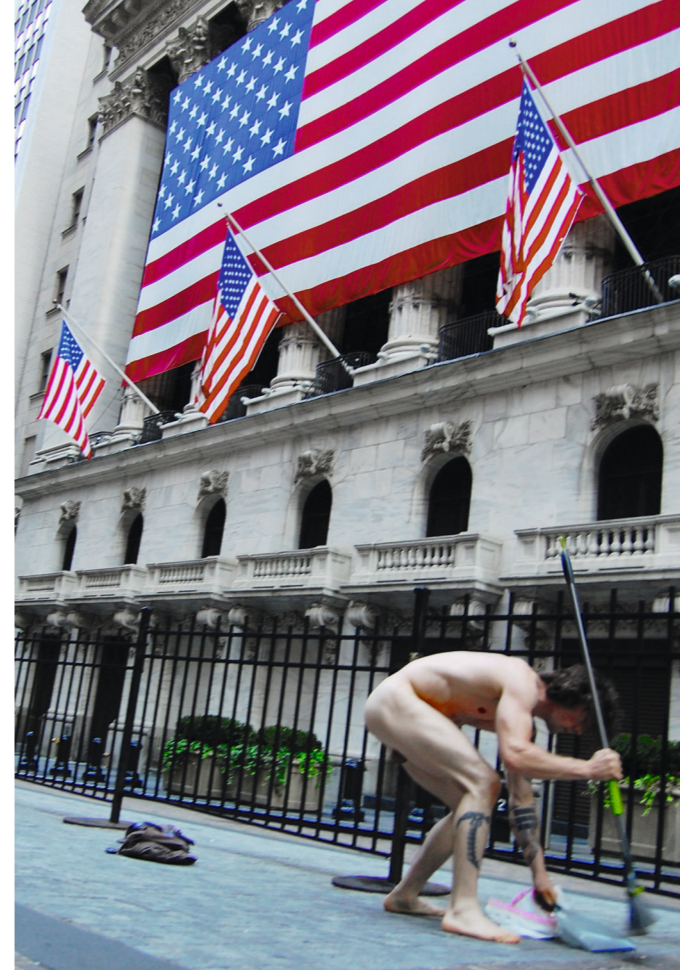
Zefrey Throwell: Ocularpation Wall Street, August 1st, 2011, Monday morning at 7am. 50 people working the professions of Wall Street. ALL OF WALL STREET EXPOSED.

Kuratoren: Eckhart J. Gillen, Ulrike Lorenz