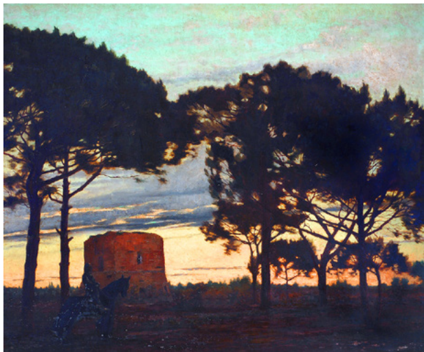
Gerolamo Cairati: Der schwarze Ritter, 1907

konservatorische Behandlung. Werden Sie BildPate und helfen Sie aktiv mit, die Sammlung der Kunsthalle Mannheim zu erhalten. Wählen Sie Ihr Lieblingswerk aus dem Bereich Gemälde, Skulptur oder Grafik aus und sprechen Sie uns an.