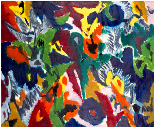
Ernst Wilhelm Nay: Oase, 1952

Aus diesem Grund hat die Kunsthalle gemeinsam mit dem Förderkreis für die Kunsthalle Mannheim e. V. im Jahr 2009 das Projekt BildPaten ins Leben gerufen, um mit privaten Spenden dringend notwendige Restaurierungsarbeiten zu finanzieren. Bislang konnten dank dieser Unterstützung 36 Gemälde, sechs Skulpturen und elf Grafiken sowie rund 60 Rahmen für über 300.000 Euro restauriert werden. Dennoch warten noch zahlreiche weitere Werke auf