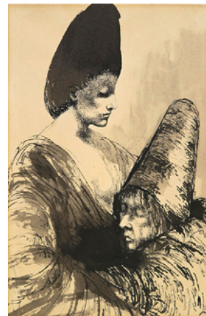
Hanna Nagel: Tröstung, o. J.