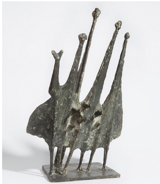
Kenneth Armitage: People in the Wind, 1950