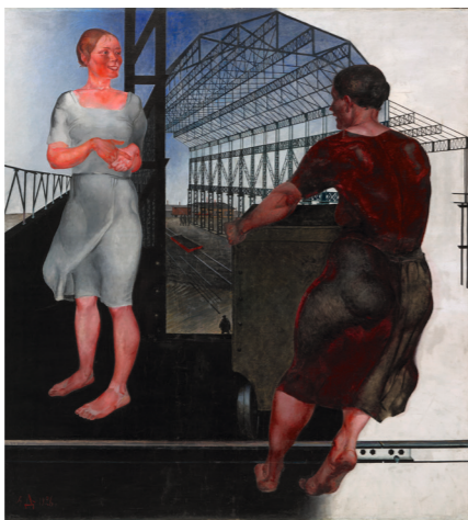
Alexander Deineka, Beim Bau neuer Werkhallen, 1926, Tretjakow Galerie Moskau, Foto: Alexej Sergeew © VG Bild-Kunst, Bonn 2018

Being determines consciousness. Economic, social, and political processes change our lives, our society. Ten years after the financial crisis, the special exhibition Constructing the World will shed light on the tangible influence of the economy on art and artists for the first time. An international comparison of the visual arts between the two World Wars and the present moves through a dramatically changing world of people's experiences and work. Around 250 paintings, films, photographs, collages, and multimedia installations by approximately 150 artists and collectives from over 20 nations reflect upon questions and depict topics which today are more relevant than ever.